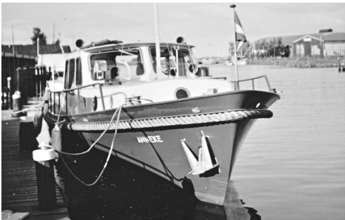
"Anneke" afgemeerd in de Rotterdamse thuishaven.