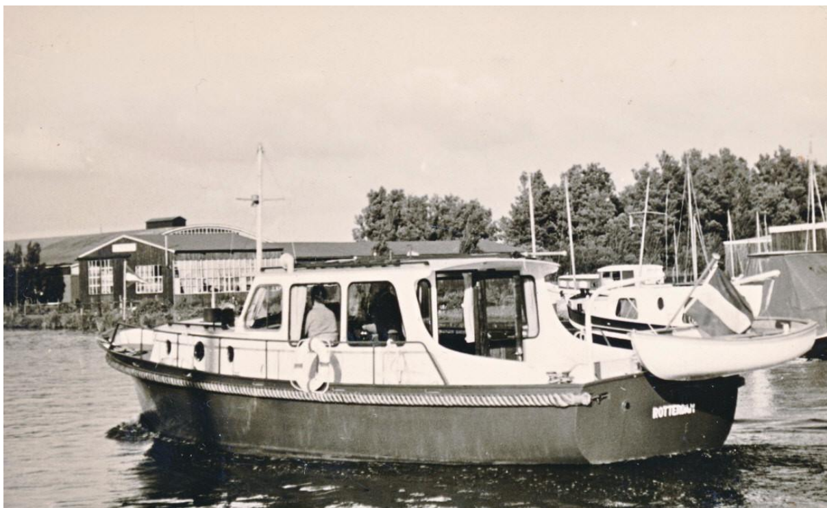
De "Anneke" voor de thuishaven in Rotterdam.