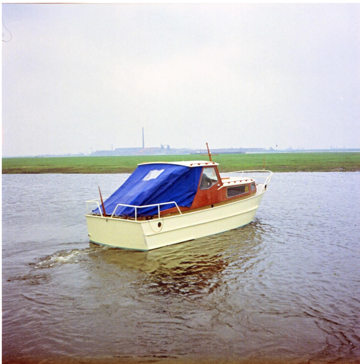
Waalkruiser van achteren.