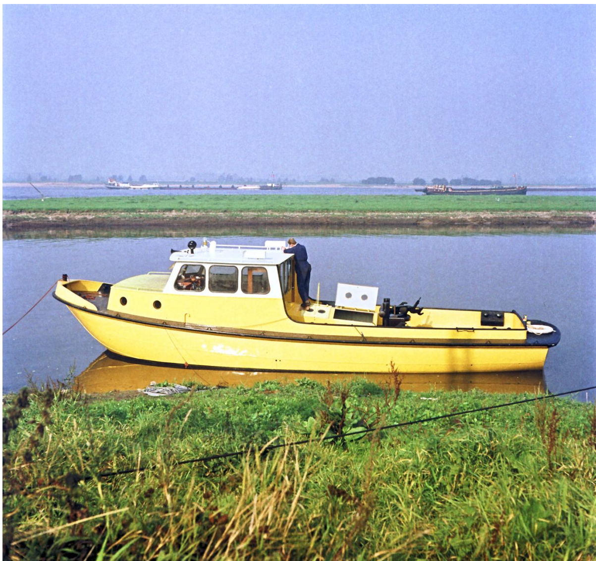
De zelfde gele sleepvlet vaarklaar.