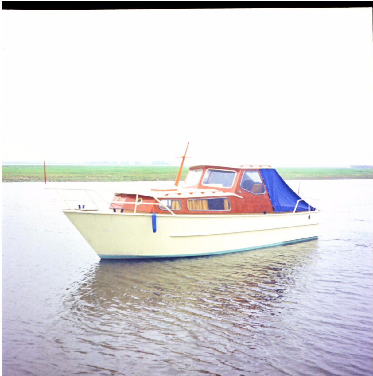
Waalkruiser van 9 x 3 meter aan bakboord. Eigen ontwerp. 1965