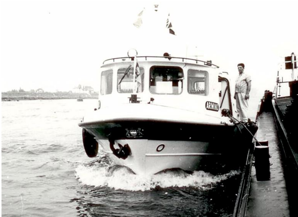
Oude Nol met zijn nieuwe ^Armino`` in vol bedrijf op de Waal.