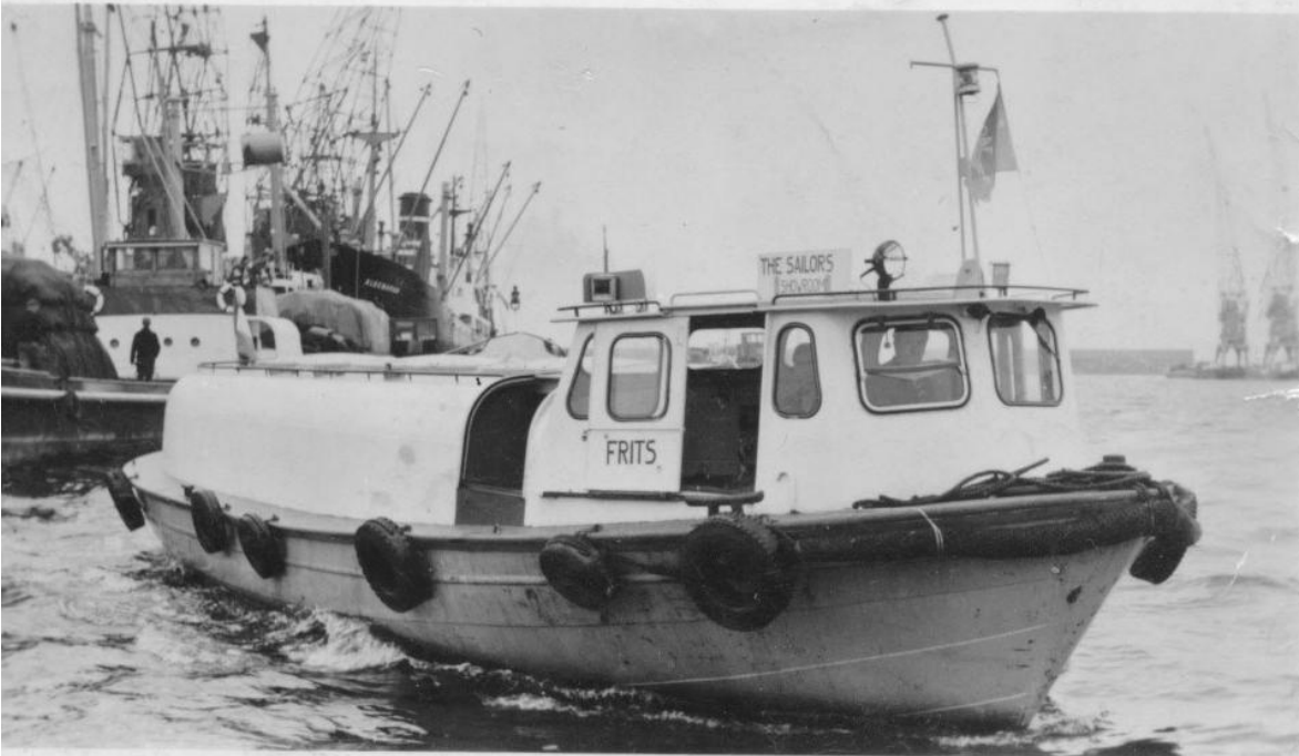
Sailor's - Showboat - Frits -