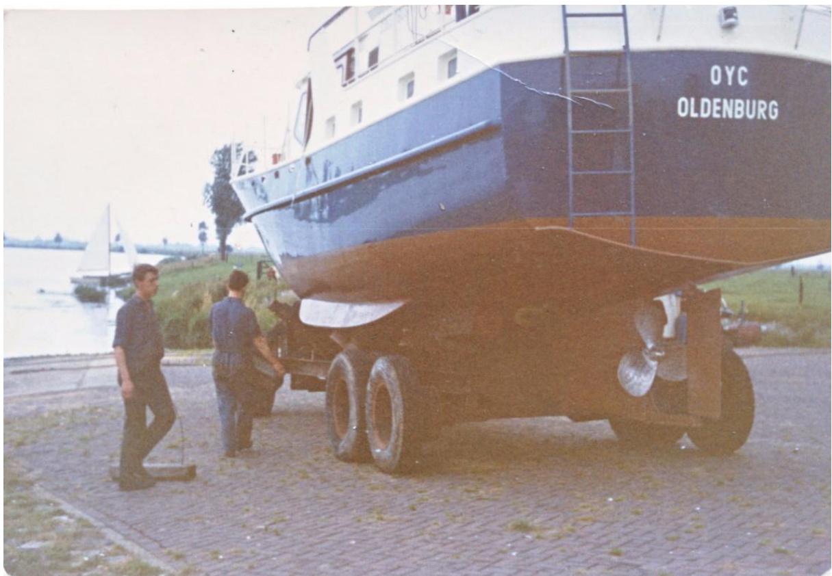
De "Columbus" bij de afrit van het pontveer aan de Maaskant. 1966