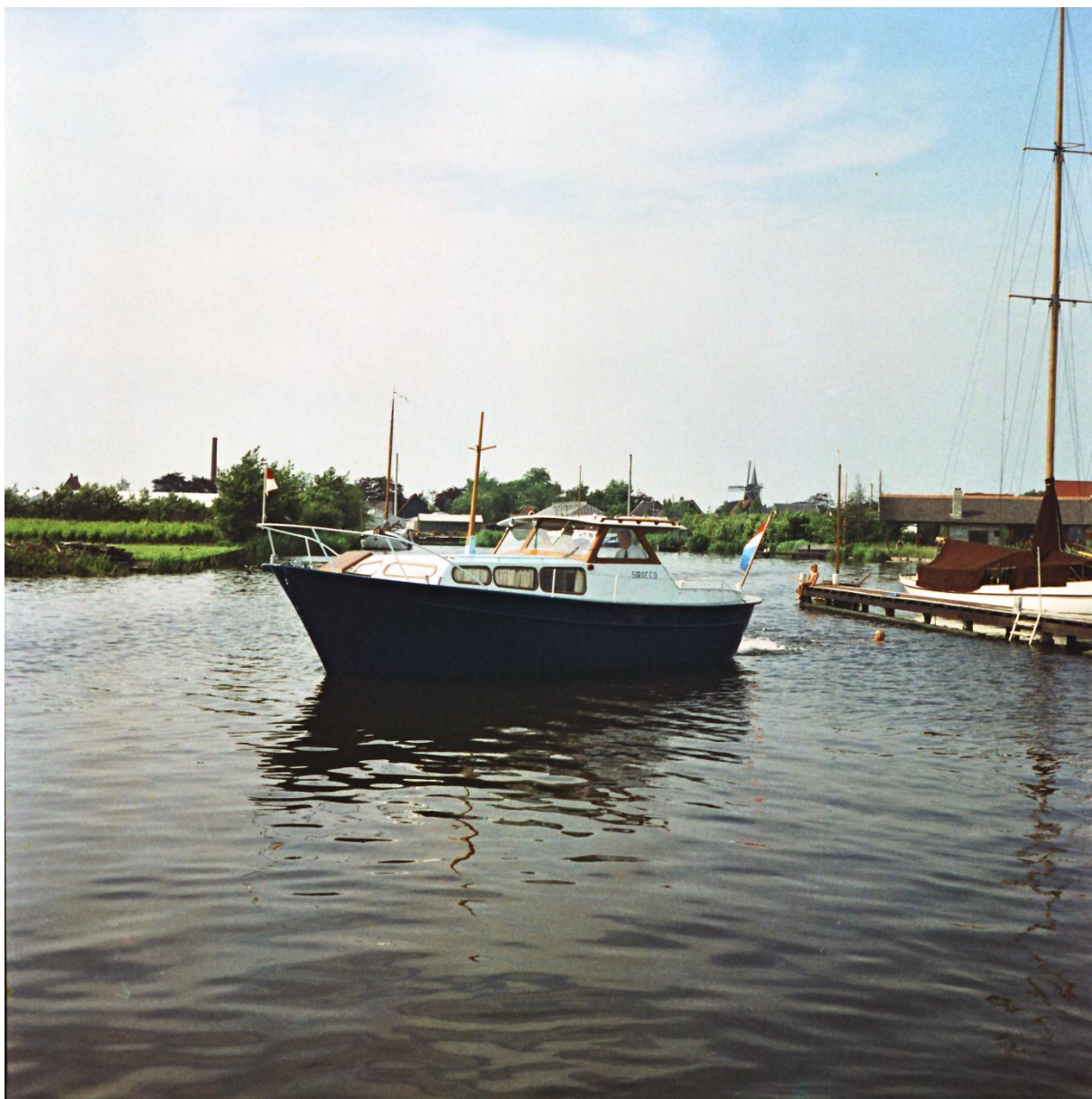
De Wielkruiser “Sirocco” Een achtmeter motorkruiser met diepe kiel aan de Maas.