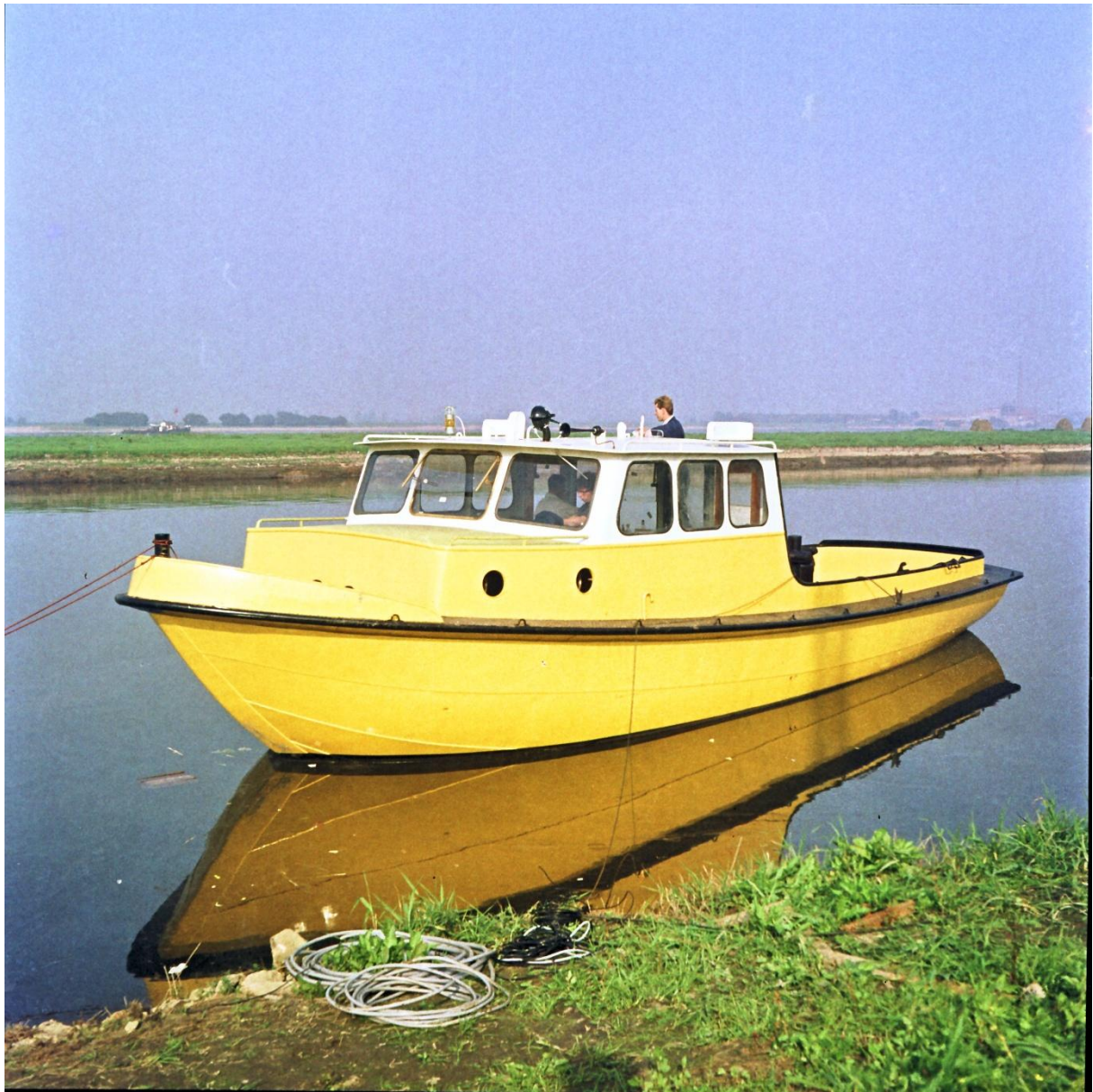
Sleepvlet in het geel.