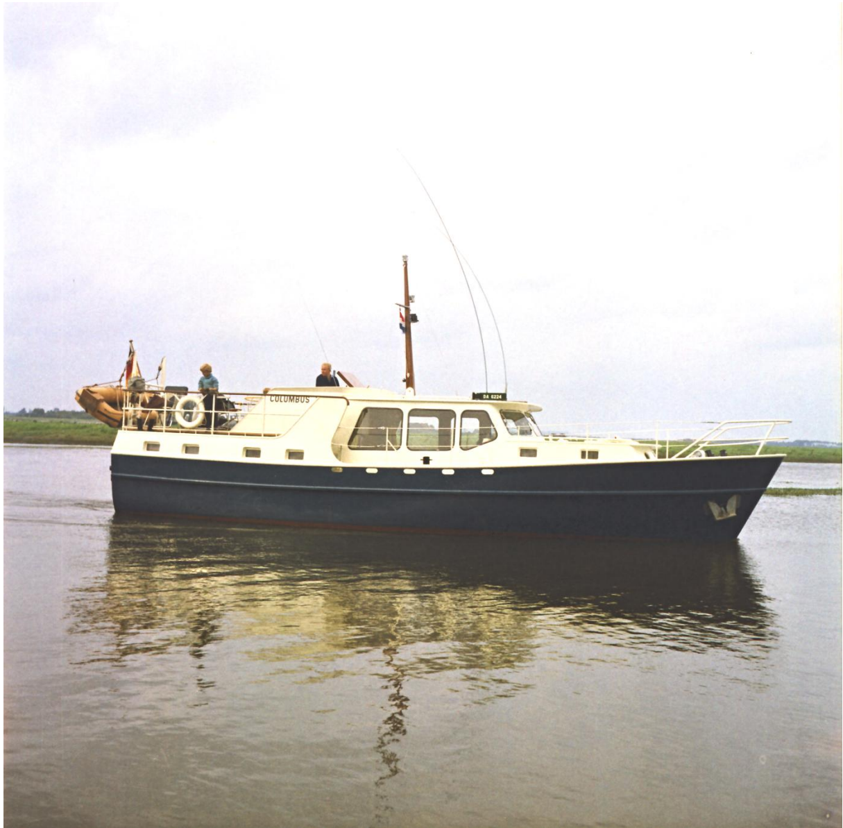
De Columbus met gezin van de eigenaar varend in de Strang.