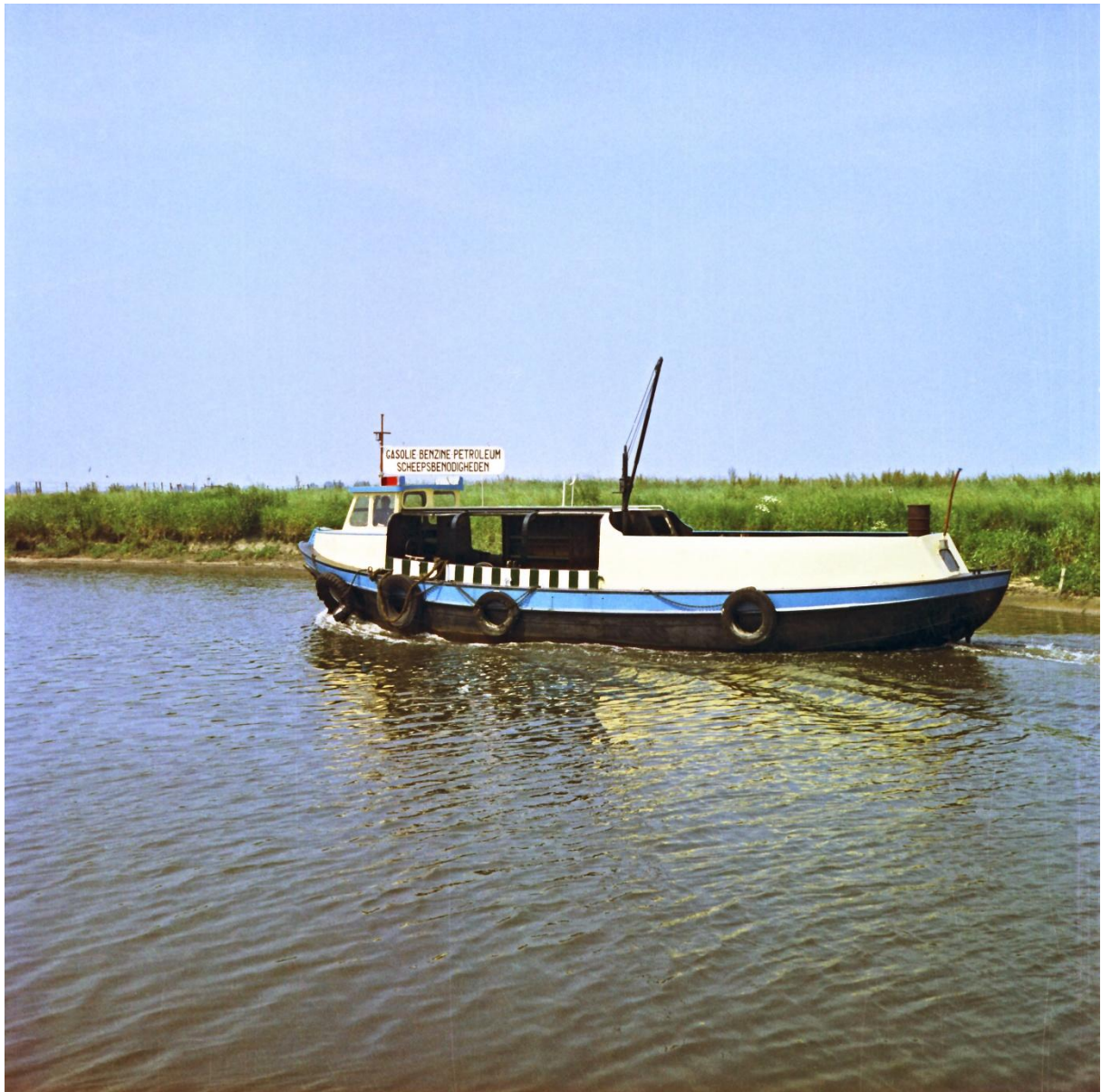
Parlevinker van Toon Udo?