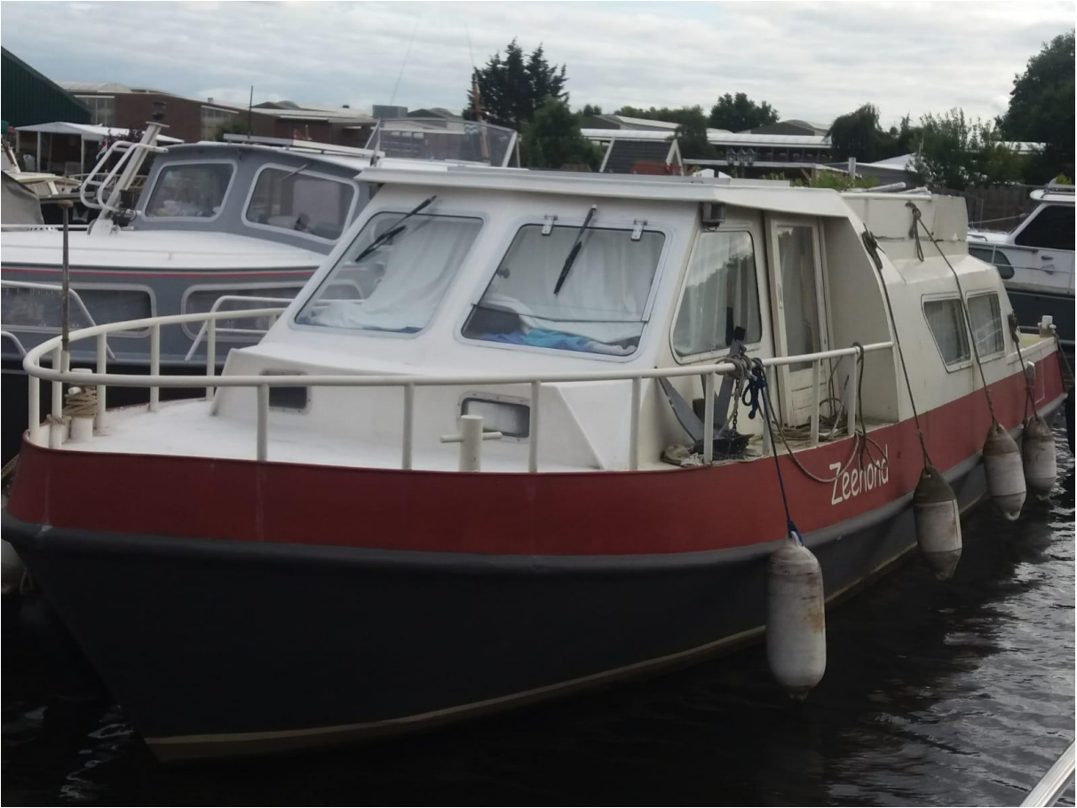
Dezelfde Swin Patio van voren.