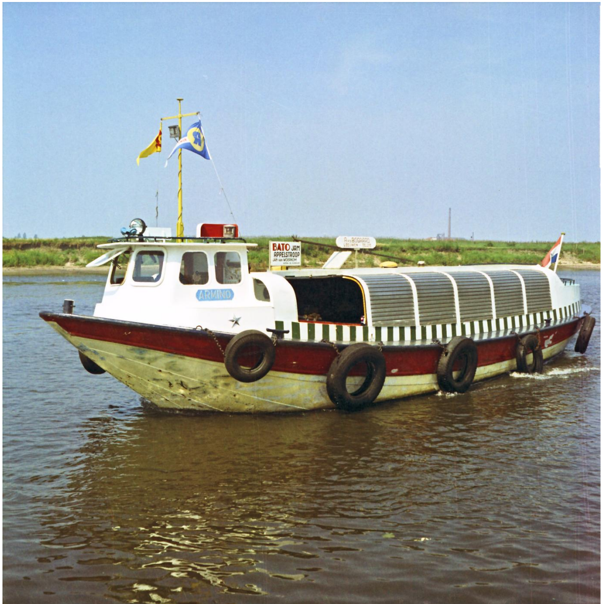
“Armino” met de oude Nol van voren. Bouw en jaartal onbekend.