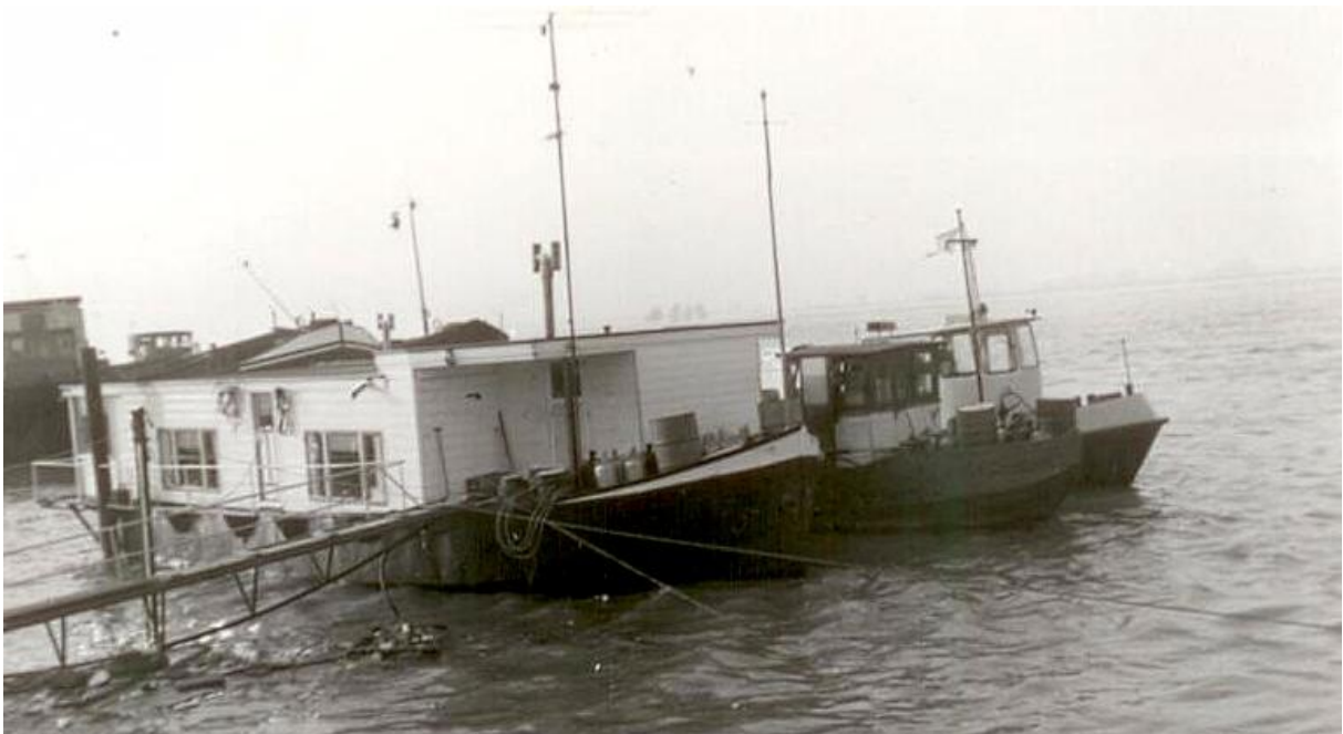
Op de bovenstaande foto, genomen omstreeks 1964, is goed te zien dat het parlevinken vooral met hoog en ruw water een ongemakkelijk bestaan was. Naast elkaar liggen: de woonboot van het gezin van Nol van den Bogaard, daarnaast de oude tot waterboot omgebouwde snik-