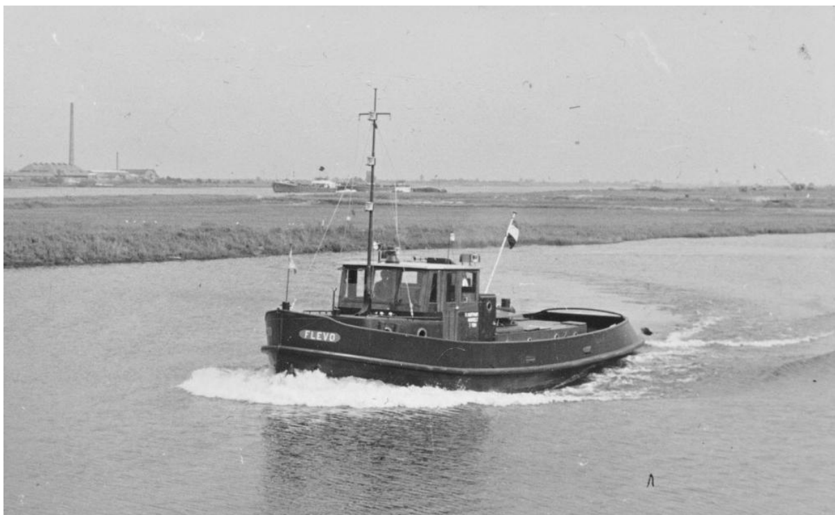
Riviersleepboot “Flevo” van Houtermans? uit Hasselt in de Strang met Nederlandse gastvlag. Herkomst van de foto, eigenaar en werf onduidelijk.