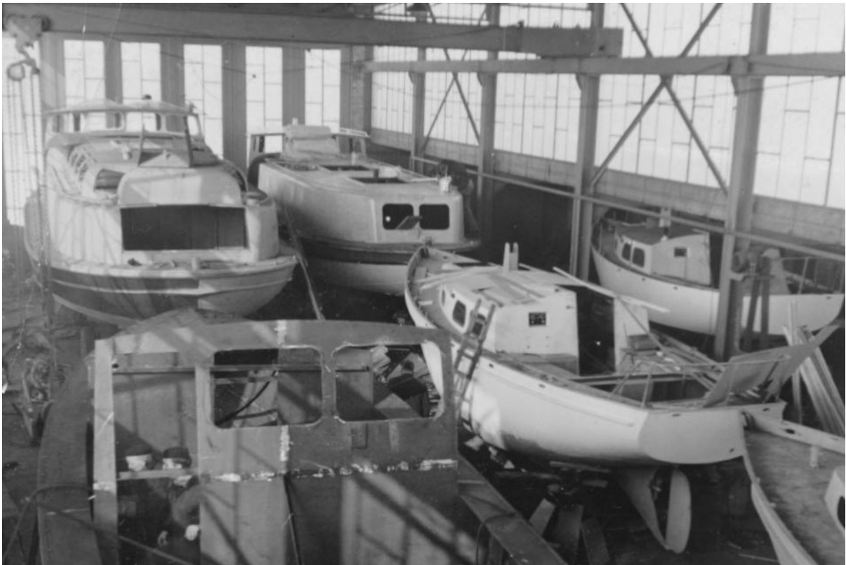
Vol interieur van de bouwhal aan de Nijverheidstraat met zes schepen in aanbouw rond 1964. Twee parlevinkers, drie Lemstra kiel-middenzwaard-zeiljachten en op de voorgrond een werkvlet.