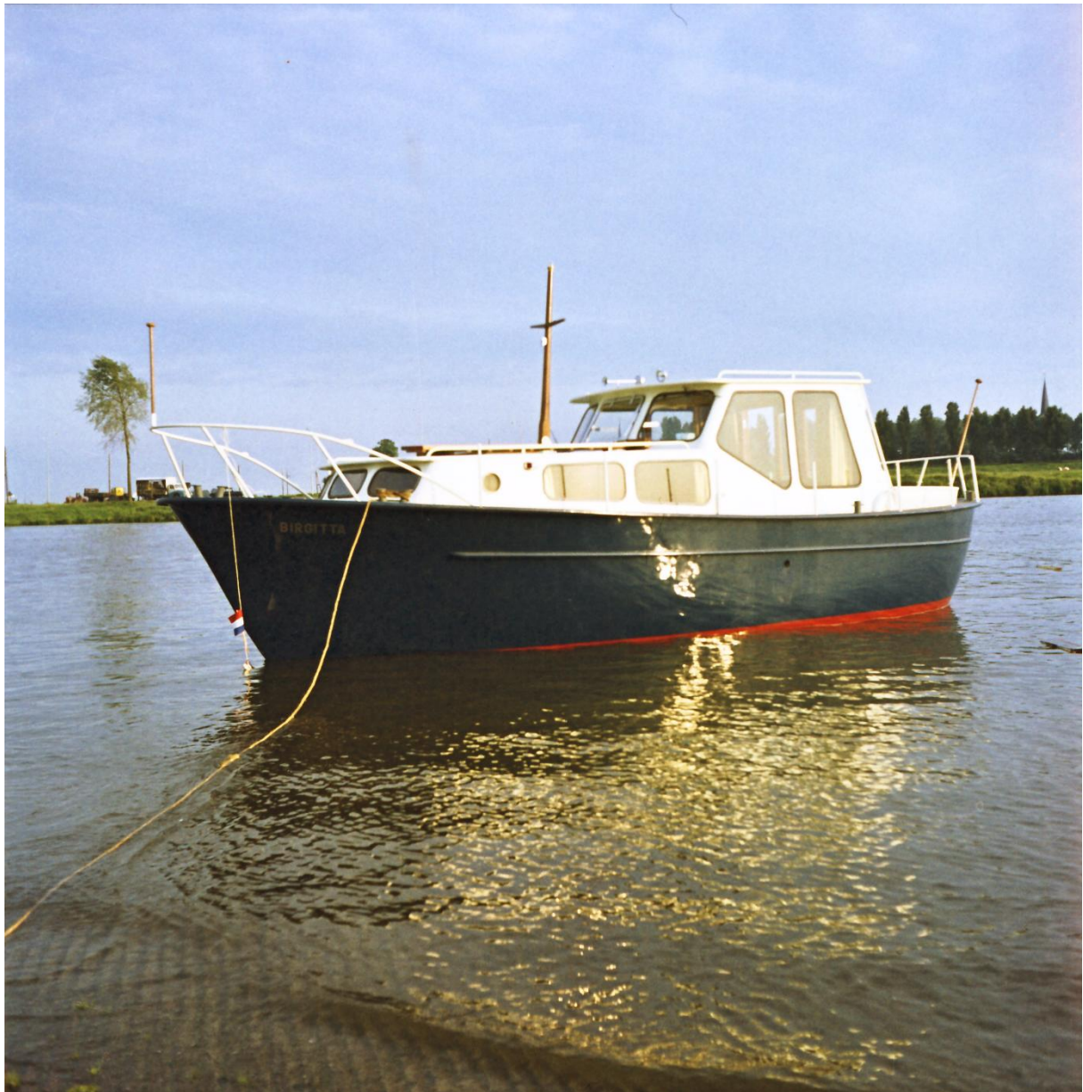
9 meter kielkruiser aan de Maas. Van de veearts uit Zelhem?