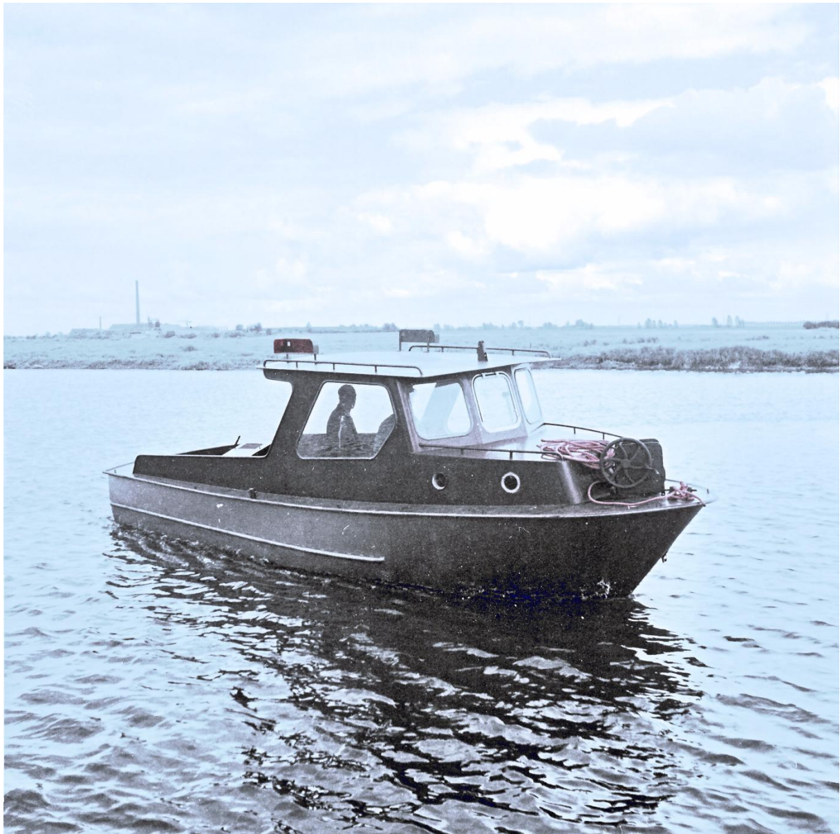
Vreemd tussendoortje van 8 meter met een veel te zware lier op het voordek.