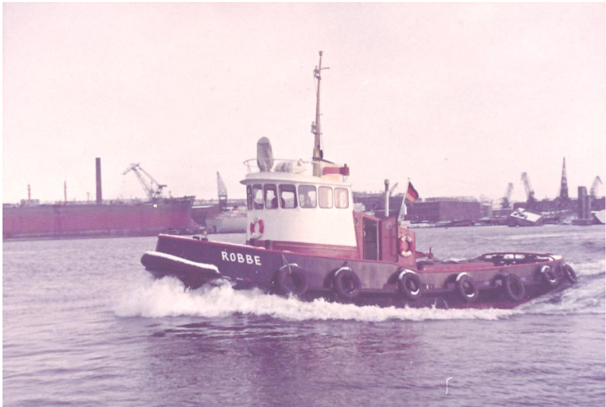
Foto's van de Robbe in de Oostzeehaven aan de Kieler Bucht. Op de achtergrond de Kieler Howaldtswerke met op stapel staande tanker.