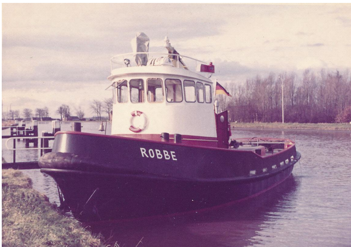
De havensleepboot Robbe aan de steiger. Opdrachtgever/eigenaar Max Körfer uit Kiel in Duitsland. Ontwerp: Herman Jansen, Monnickendam. 1967