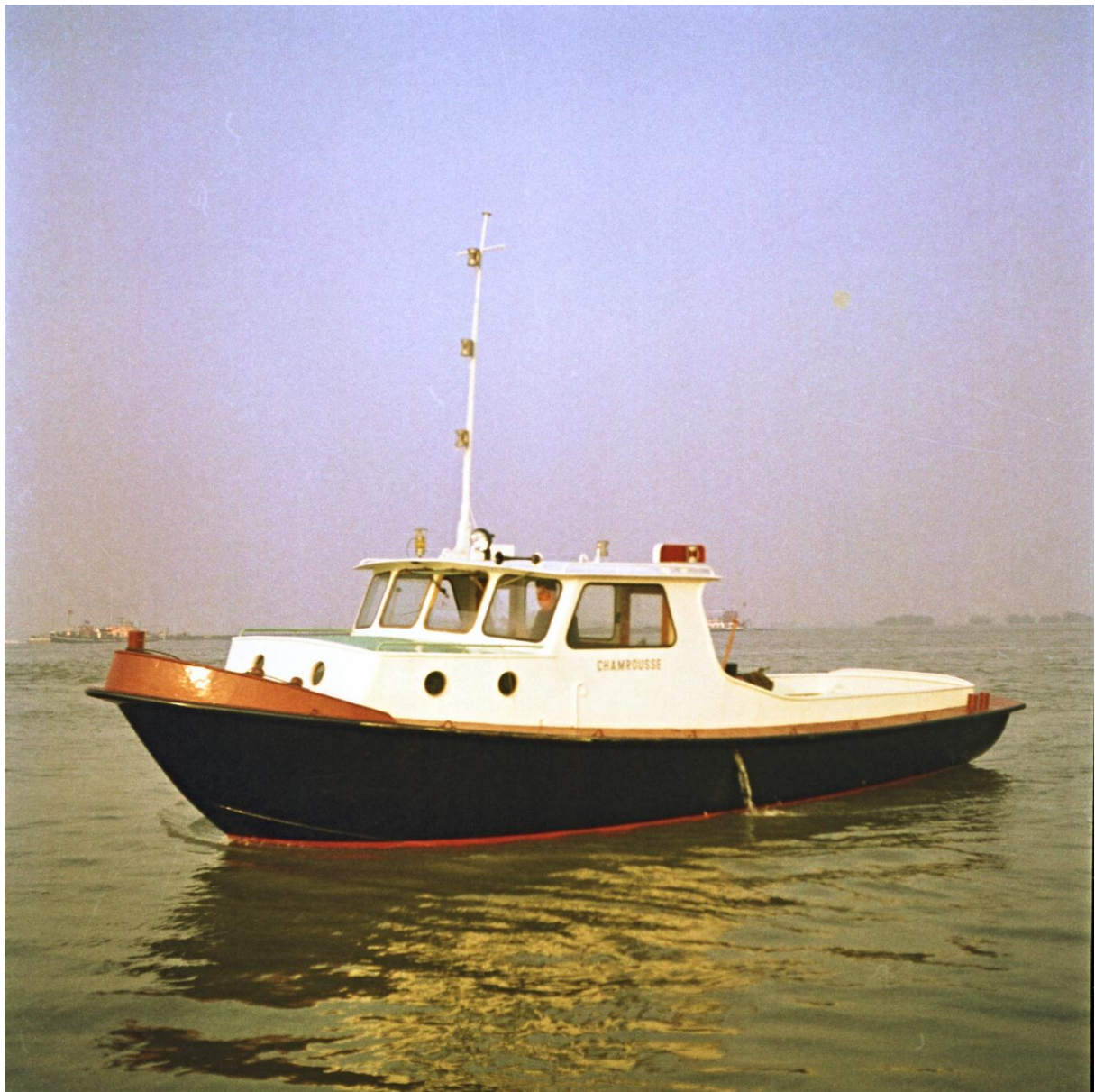
"Chamrousse" in 1966 Sleepvlet van 13 meter. Eigen ontwerp. Voor Franse rekening gebouwd via de Scheepsmakelaar Key.