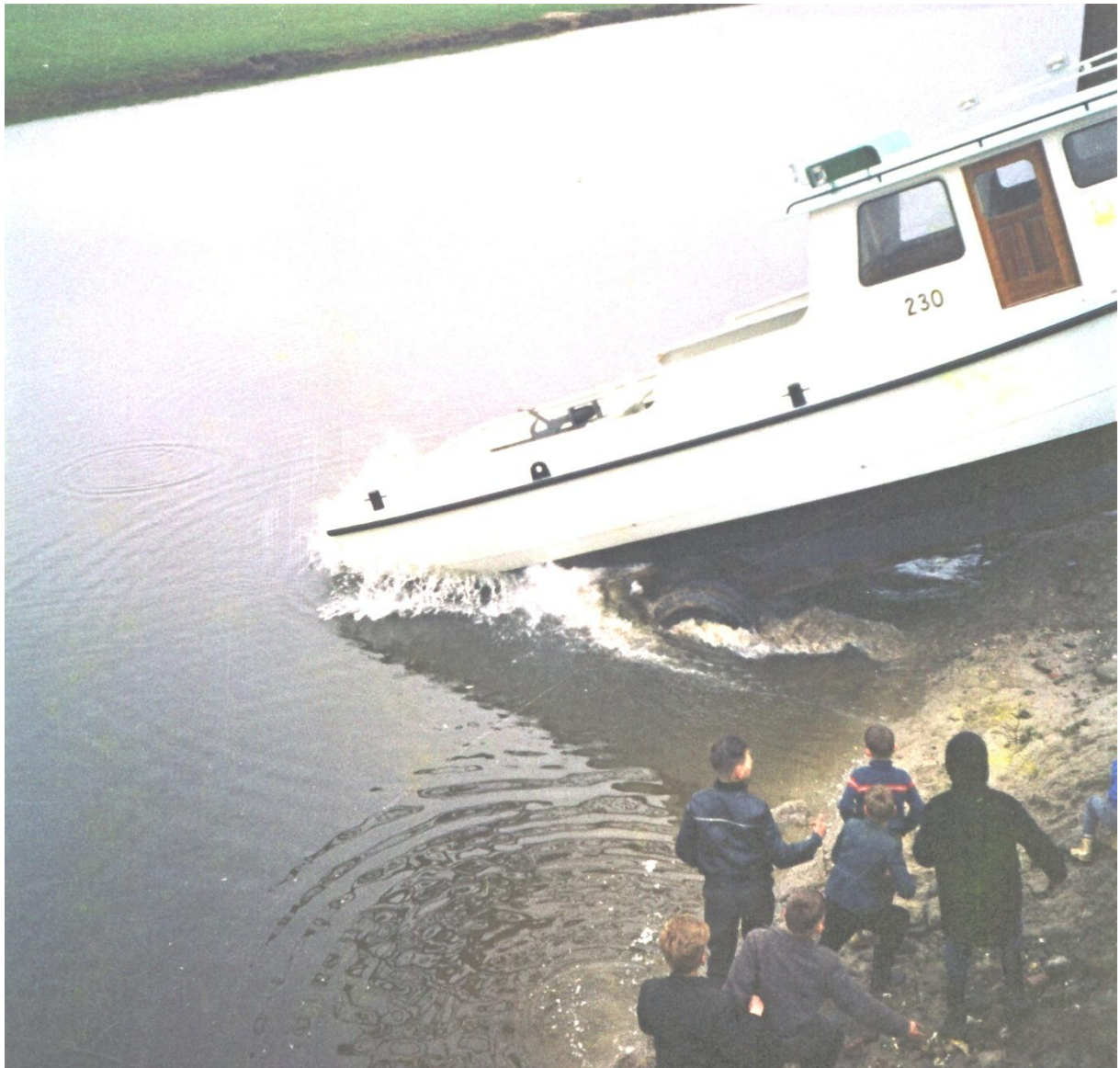
De 230 op het moment van het eerste contact met het water in de Strang.