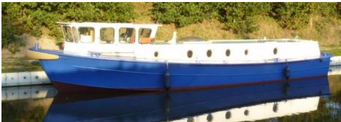
Dezelfde boot bij Dordrecht in 2012, nu in gebruik als jacht.