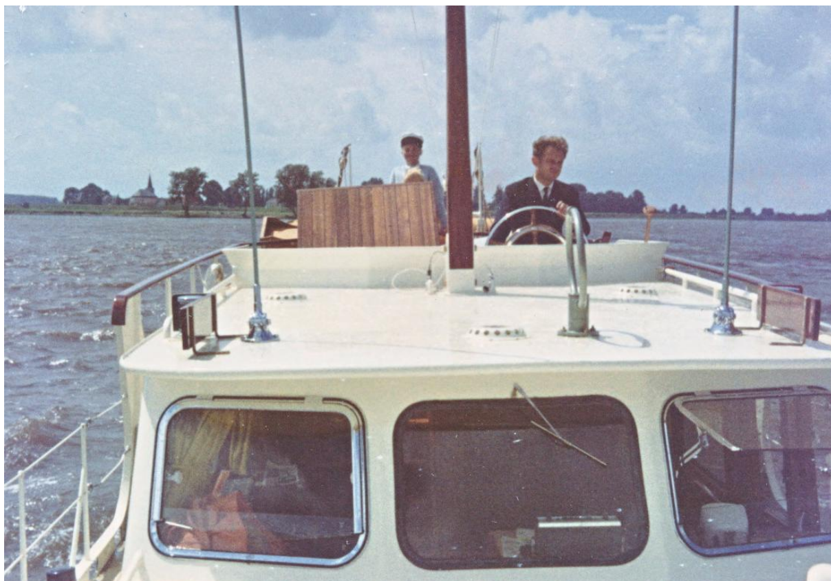
De samensteller van dit fotoboek zelf (met stropdas aan en nog met volle hardos) aan het stuurwiel op de Waal in 1966. De eigenaar Körner staat bij de kajuitingang.