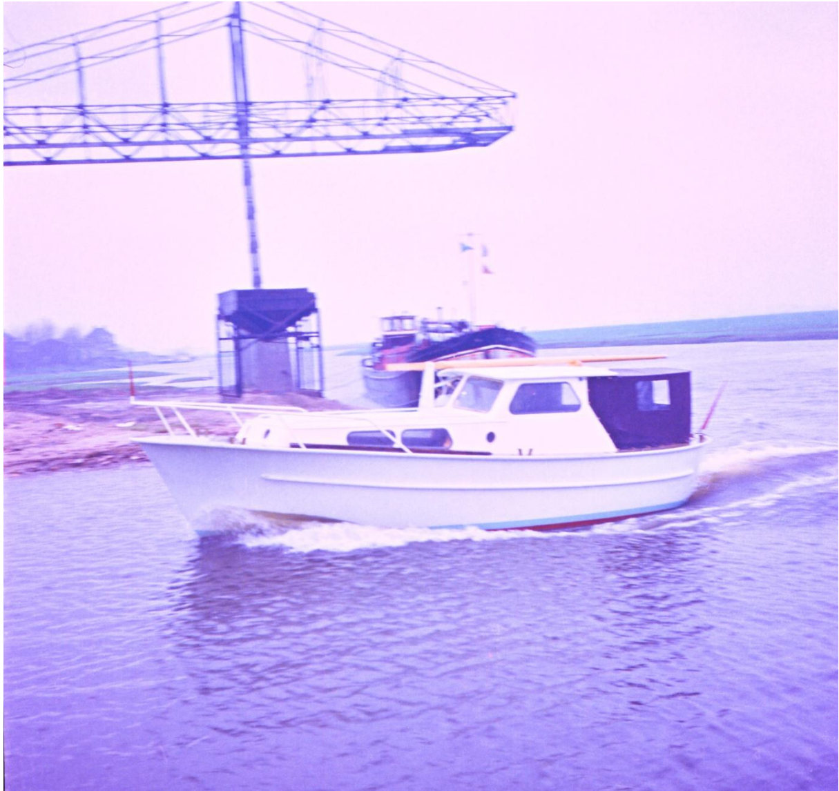
Kieljacht van 8 meter. Met lange mast, liggend op het dek, die dient voor een steunzeil. Ontwerp Herman Jansen, 1966