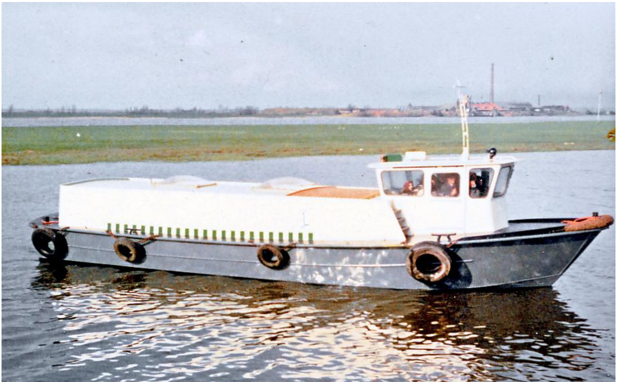
Parlevinker voor de haven van IJmuiden. Eigen ontwerp. 1966