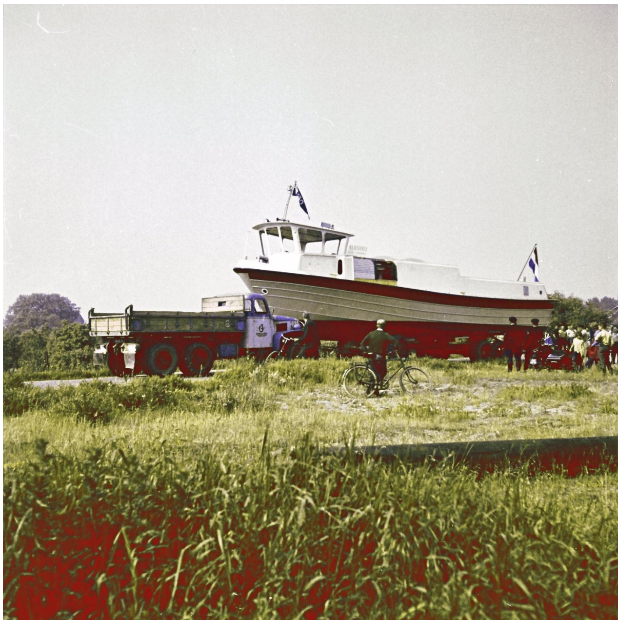
De nieuwe parlevinker van slagerij Lemmers in Beneden Leeuwen, kort voor de tewaterlating aan de dijk bij de Klef. De vrachtwagen is al gedraaid om het geheel naar de afrit te sturen.