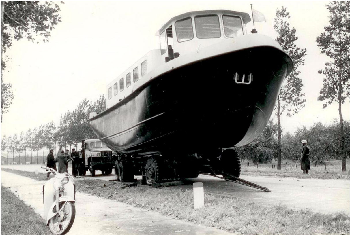
Bandenpech op de grote weg naar een afrit aan de Maas. De rechtervoorband begaf het.