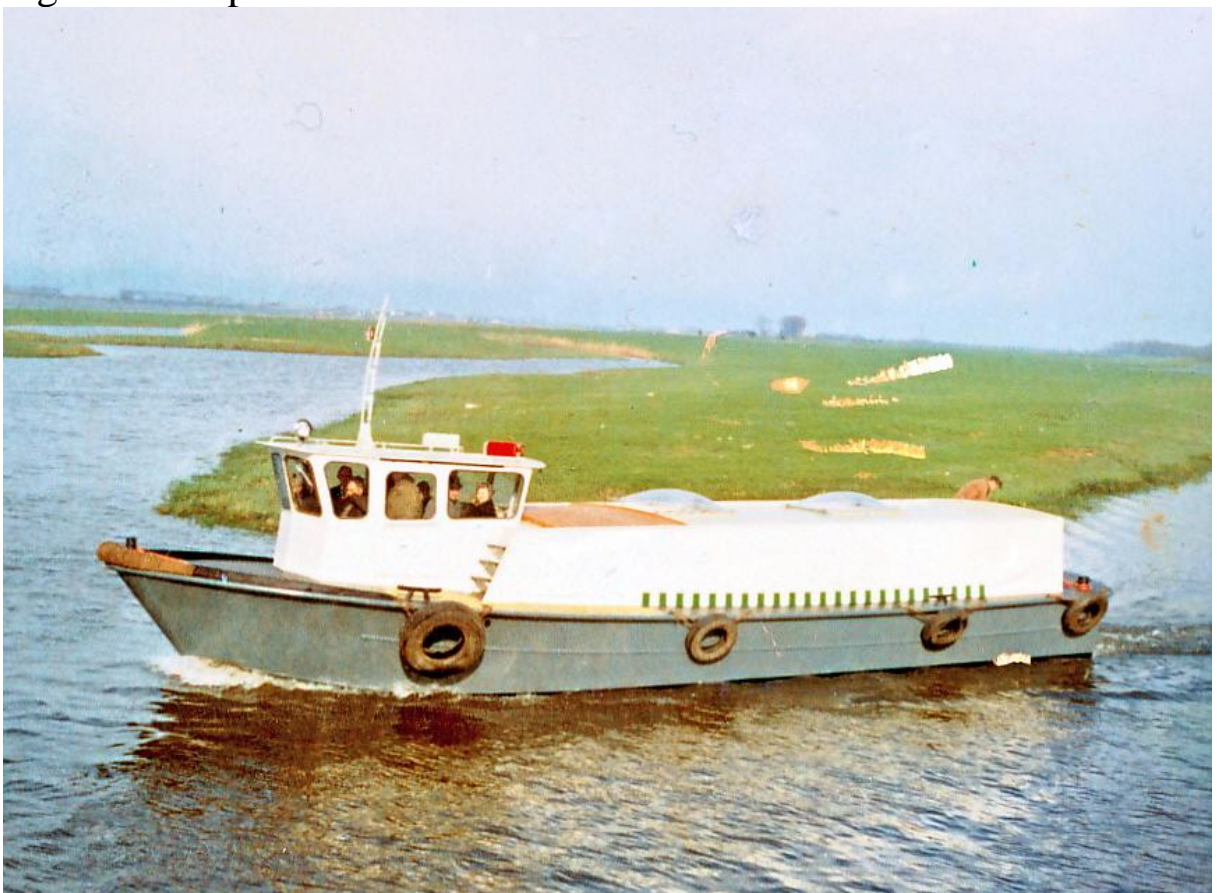
Proefvaart met familie op de Strang. 1966