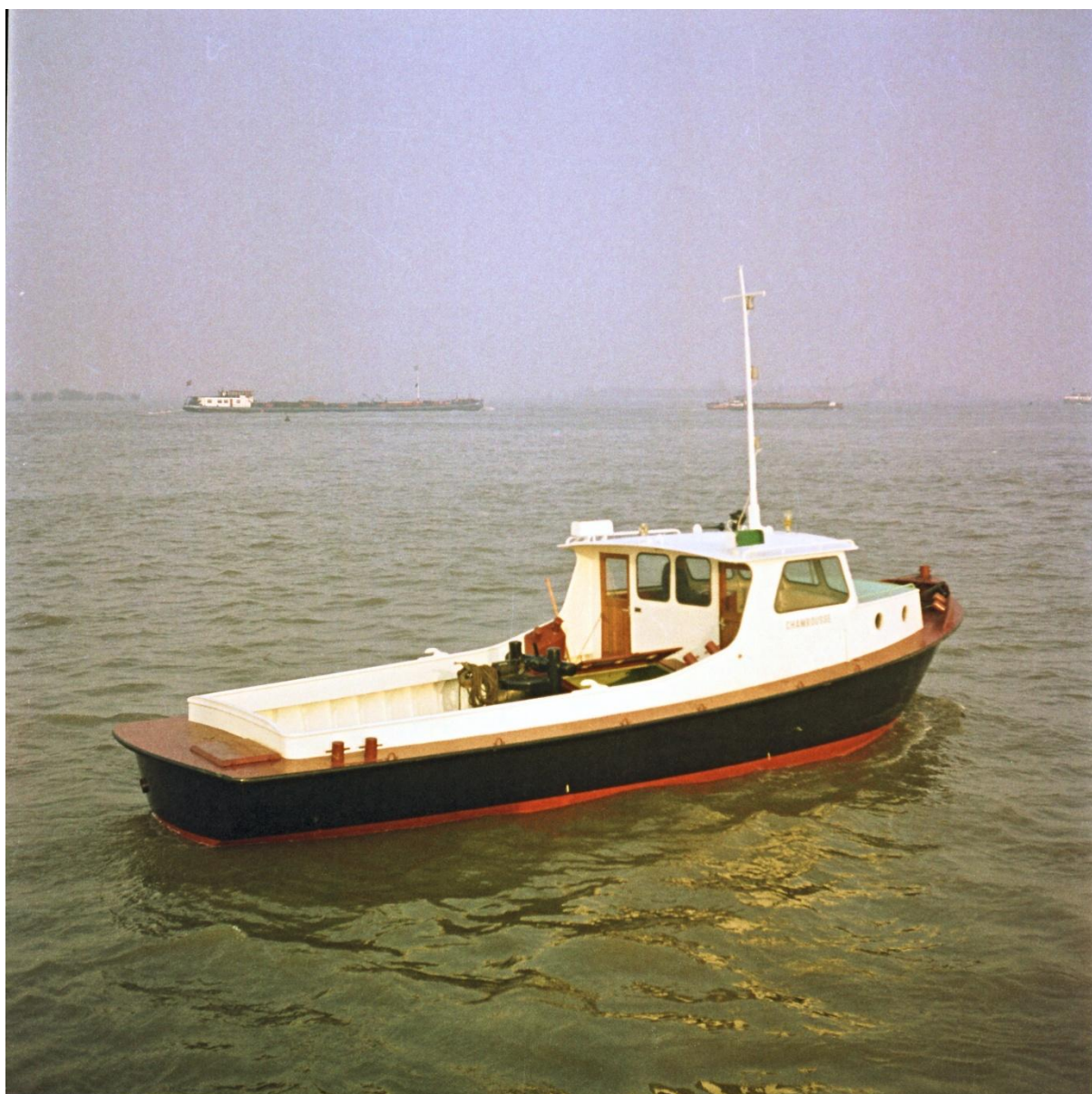
Sleepvlet "Chamrousse" van achteren.